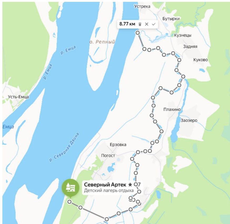
Рисунок 2 - Нить водного маршрута для сплава на катамаранах по реке Пингиша