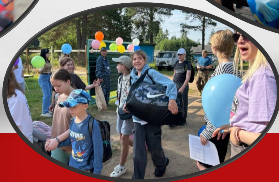
ДЕТИ ПОБЕДИТЕЛИ ПРИЗЁРЫ