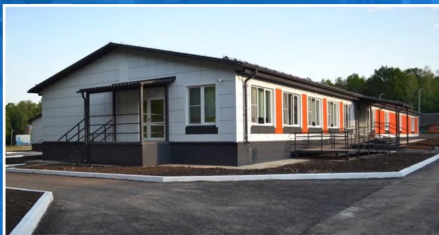
Тульская область - ЗОЛ Им. С. Чекалина