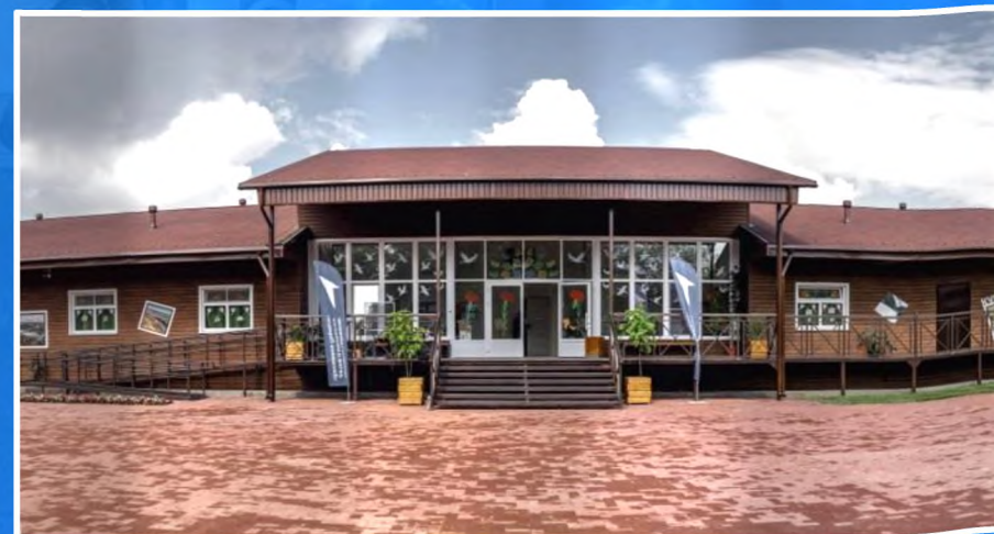
Ставропольский край - ДОЛ «Гренада»