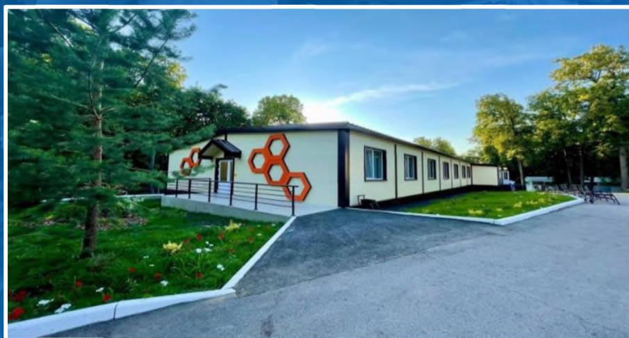
Республика Башкортостан - ДОЛ «Чайка»

Новых мест для отдыха детей и их оздоровления