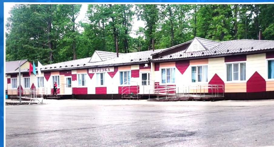
Республика Мордовия – ДОЛ «Изумрудный»