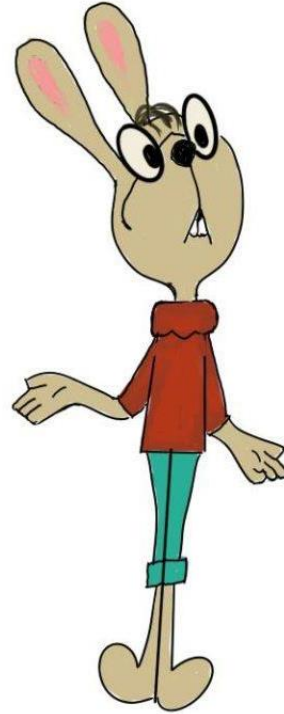
планета Технологи ТЕХНОЛОГ

«Много новых интересных подходов, технологий, буду применять эту методику».